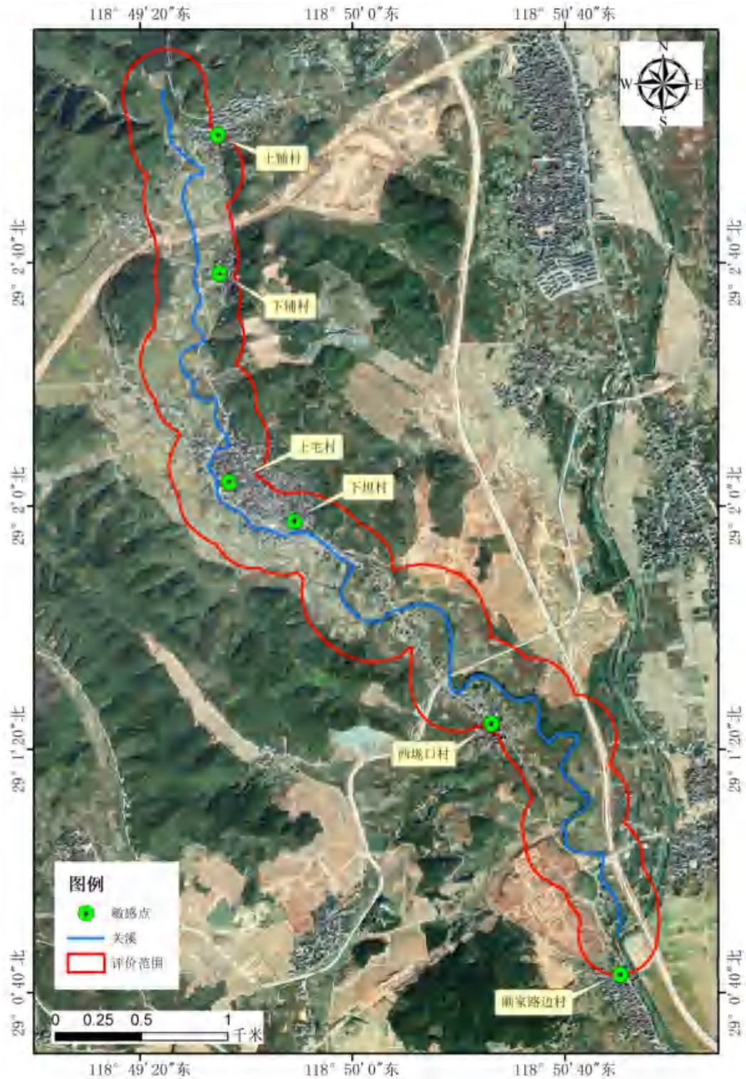
图 2-1 本工程环境保护目标分布图