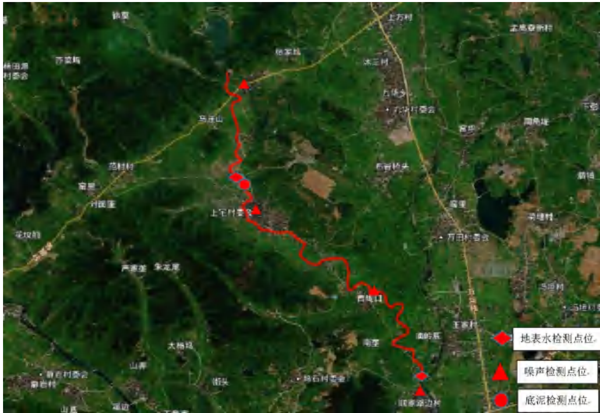
图 8-2 环评地表水监测点位图

根据对比可知，经过本项目工程整治后水质有所改善，五日生化需氧量、化学需氧量、氨氮、总磷、溶解氧等指标均有所向好。